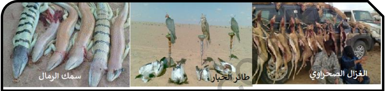
الوثيقة-2- الصيد الجائر للحيوانات النادرة