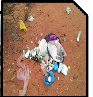
الوثيقة-3- رمي النفايات بعد نزهة الصيد

اعتماداً على ما درست و السندات المرفقة :