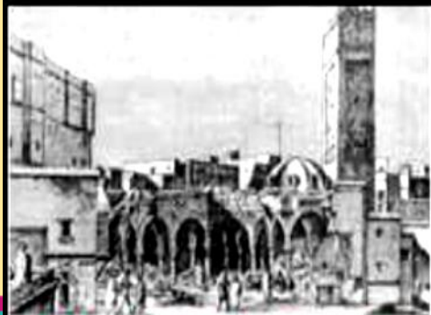
مسجد السيدة أثناء هدمه سنة 1831